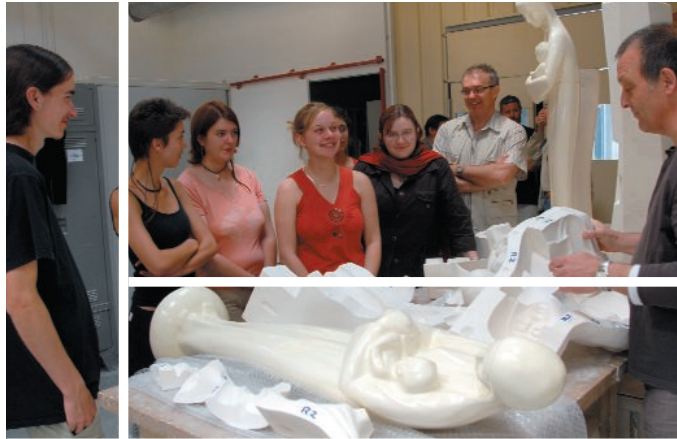
... Les élèves du lycée Henri Moisan ont reproduit une statue de vierge à l'enfant pour un client luxembourgeois.